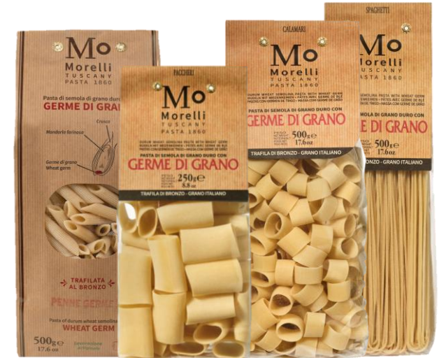
Germe di Grano