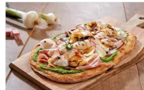
PINSA LA BOLOGNA Mortadella, cipollotto al balsamico, Provolone del Monaco, crema di piselli