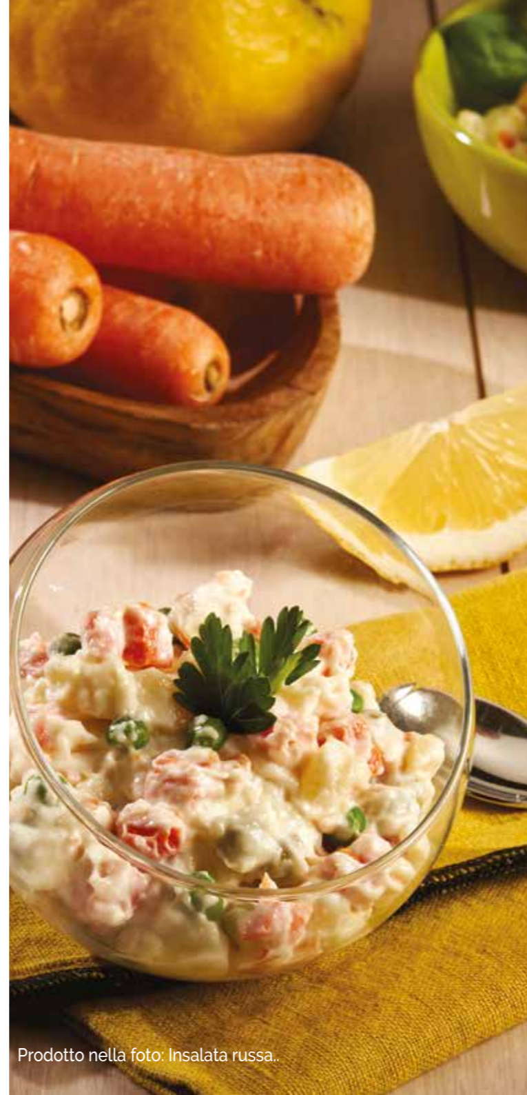
Prodotto nella foto: Insalata russa..