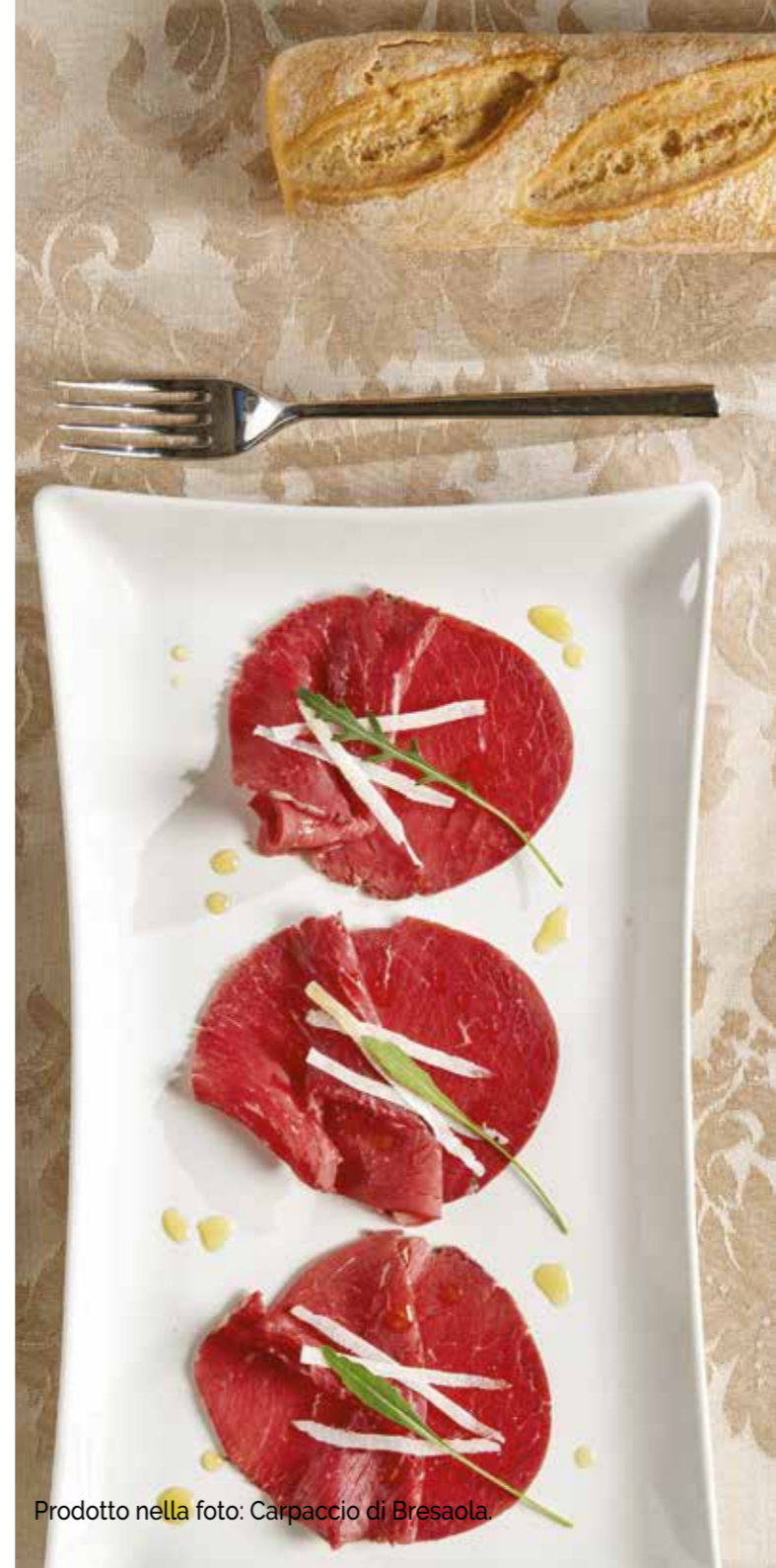
Prodotto nella foto: Carpaccio di Bresaola.