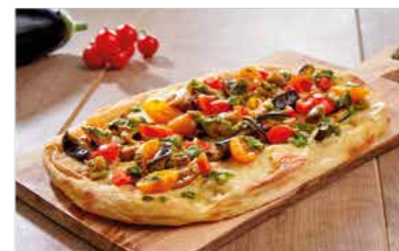
PINSA L'ORTO Orange di bufala, cubetti di melanzana, pomodorini Pachino, pesto alla genovese