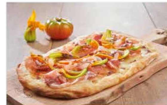
PINSA LA TERRA Culatta, Bianco di bufala, acciuga, pomodoro costoluto e fiore di zucca