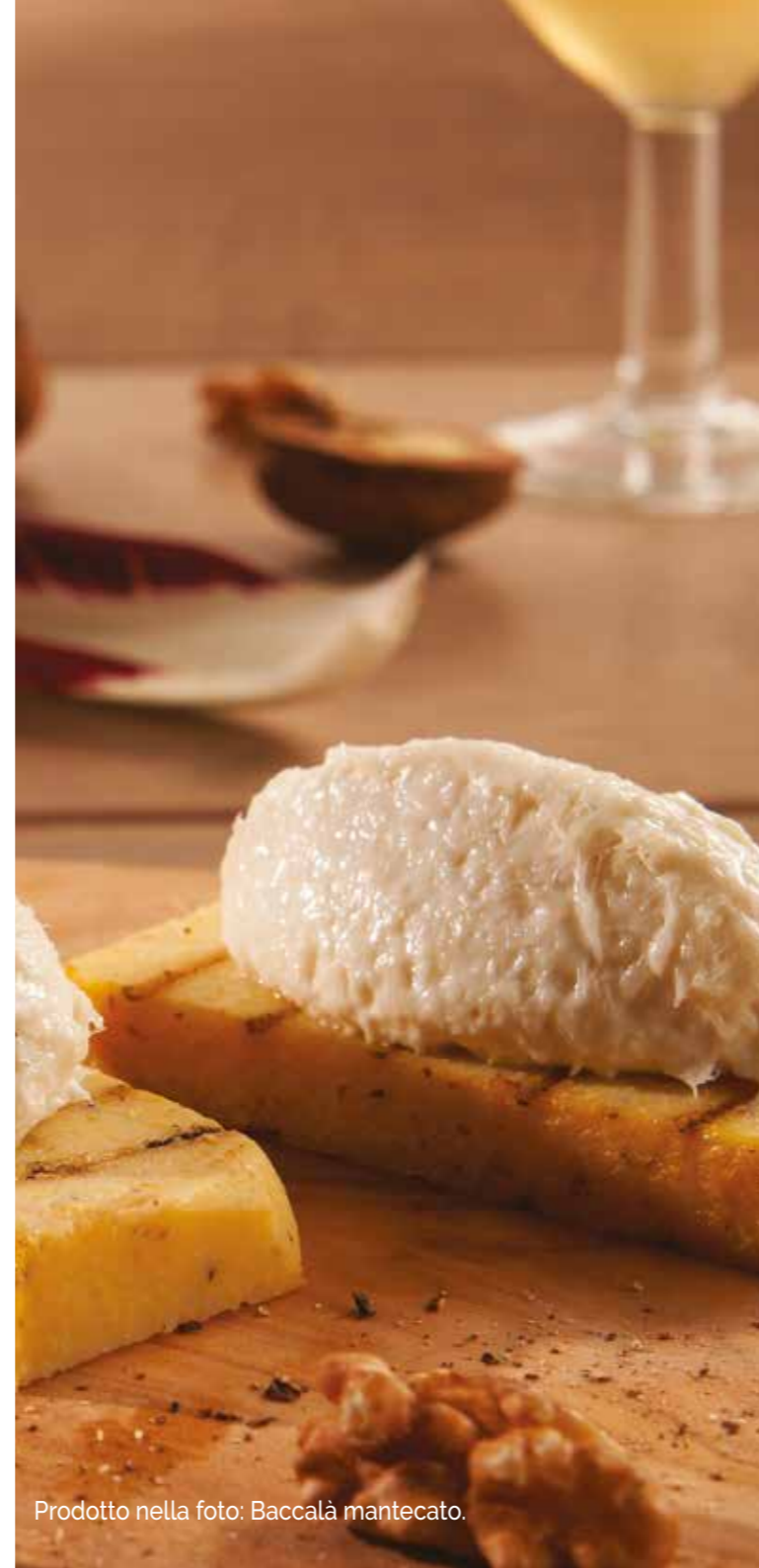
Prodotto nella foto: Baccalà mantecato.