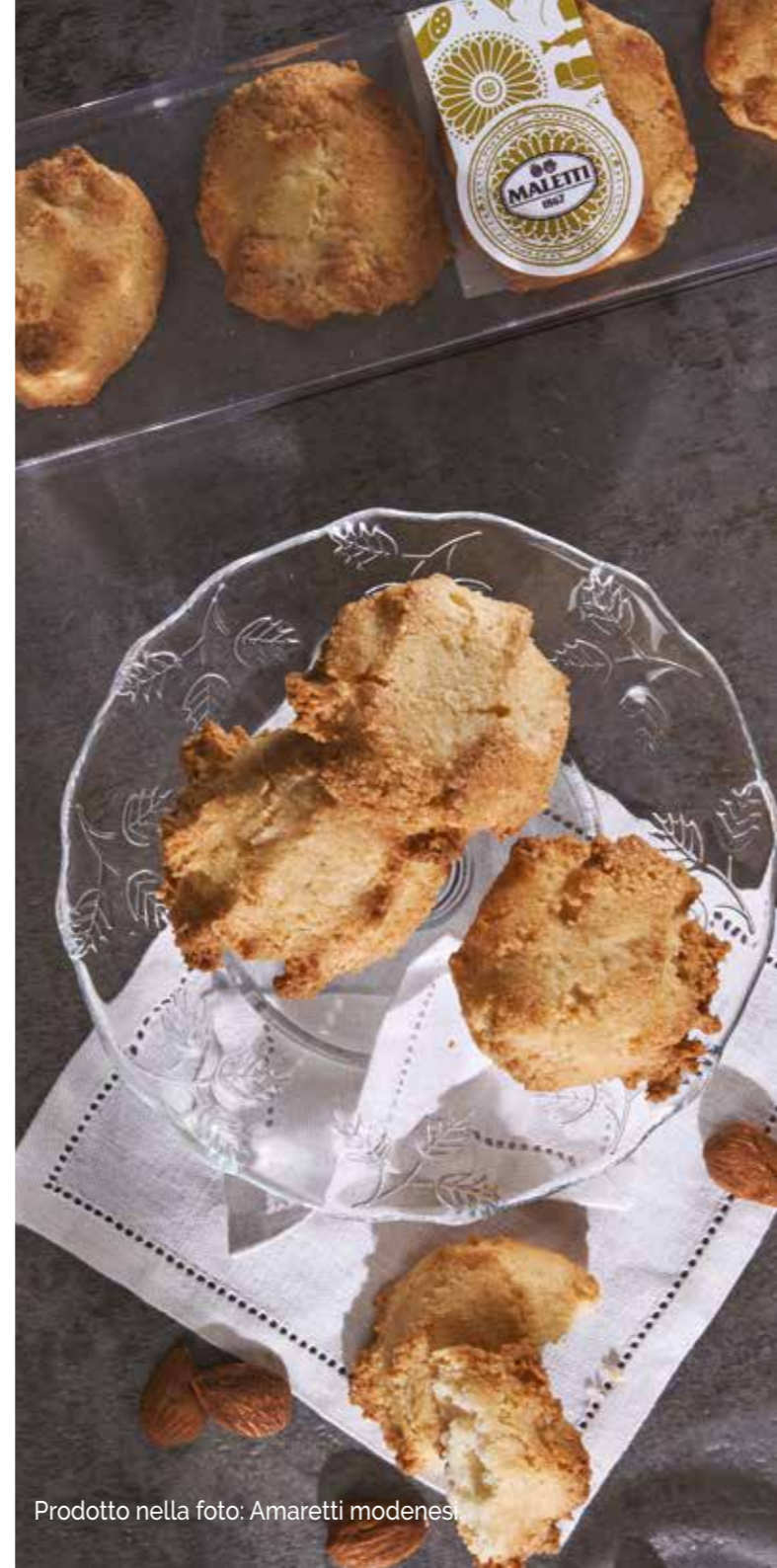
Prodotto nella foto: Amaretti modenesi.