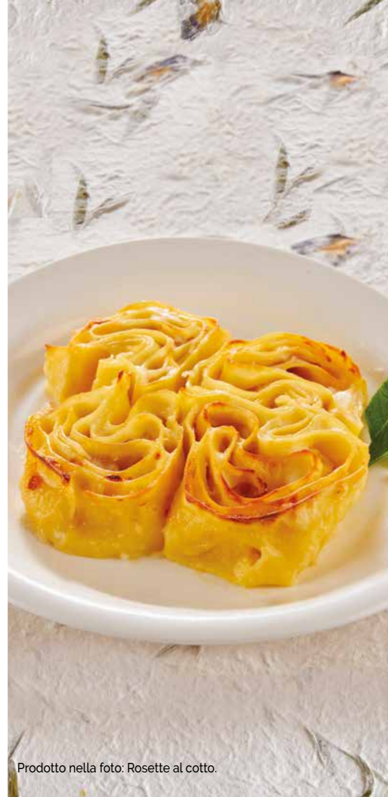
Prodotto nella foto: Rosette al cotto.