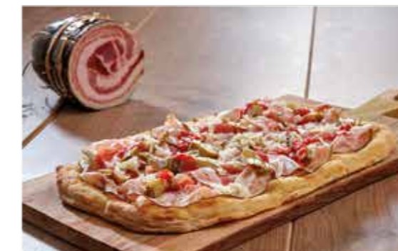
PINSA LA GOLOSA Pancetta al pepe nero, Marzolino di Amatrice, salsa ai peperoni e carciofi