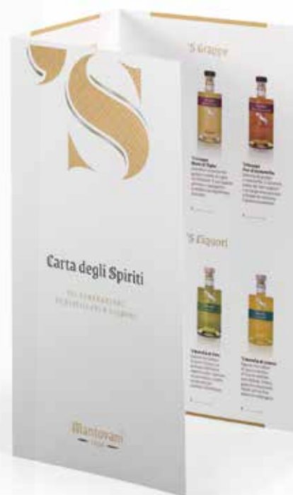
Carta degli Spiriti

Il Menu con la selezione dei prodotti Mantovani